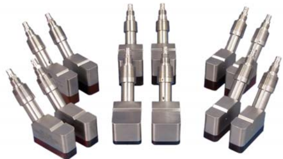
系列夹装式气体超声波探头