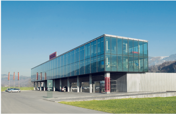
Corporate Headquarters of the Leister Group, Switzerland