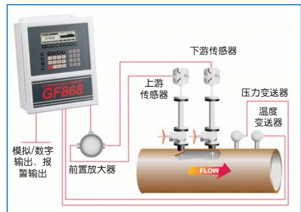
典型的表准体积流量 与质量流量测量仪表系统

作为火炬气应用的理想技术，超声流量测量不依赖于气体特性，并且不对流体流动产生任何干扰。安装于管线上的全金属超声传感器向气体顺流和逆流发射声脉冲。根据传感器得到的顺流和逆流声传播时间差，GF868的内置流量计算机使用先进的信号处理方法与互相关时差法来计算流速、体积流量和质量流量。如果输入温度和压力值，流量计就可以计算标准体积