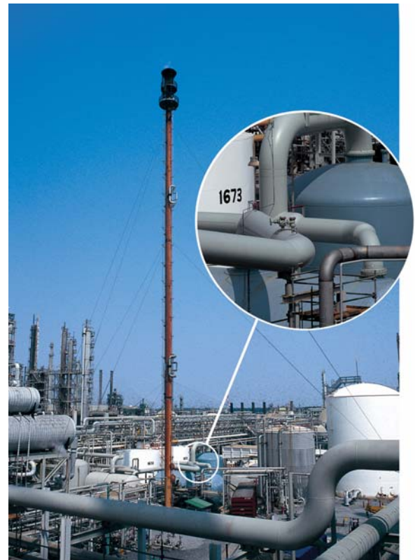
GF68现场的典型安装示意。详图显示传感器安装在通往火炬气储罐的火炬气主管上